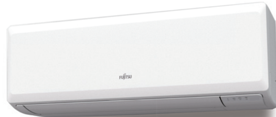
ASY 25 -35 UI-KP