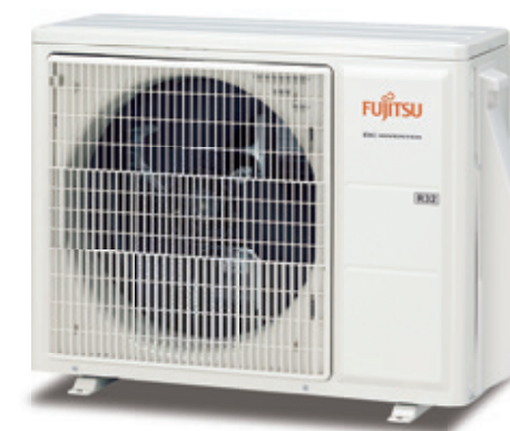
ASY 25 -35 UI-KP