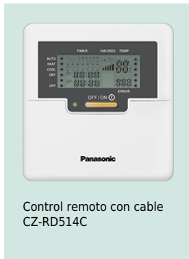
Control remoto con cable CZ-RD514C